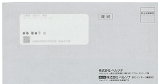
「お支払い口座届」送付封筒 (イメージ)

1週間程度で「お支払い口座届」をご自宅あてに送付します。 お名前欄にご記入、金融機関お届け印をご捺印のうえ、 本人確認書類のコピー（2点）を添付しご返送ください。 ご返送がない場合、カードの発行手続きが保留となります。